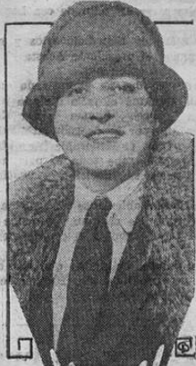
Clara Kimball Young

La hermosa artista Clara Kim- ball Young reaparecerá en el cine como estrella de la película "Kept Husbands"