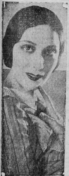
DOLORES DEL RIO

Se encuentra delicado de salud el joven don Victor Wolf, operado antier con muy buenos resultados.